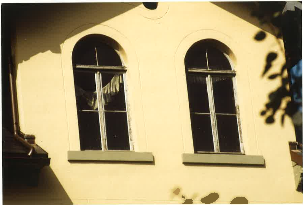
orig. Fenster im östl. Querhaus