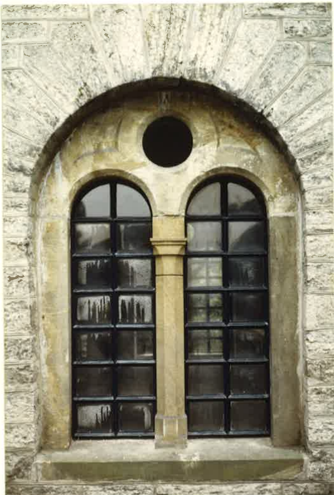
rekonstruierte Eisensprossenfenster 10/87