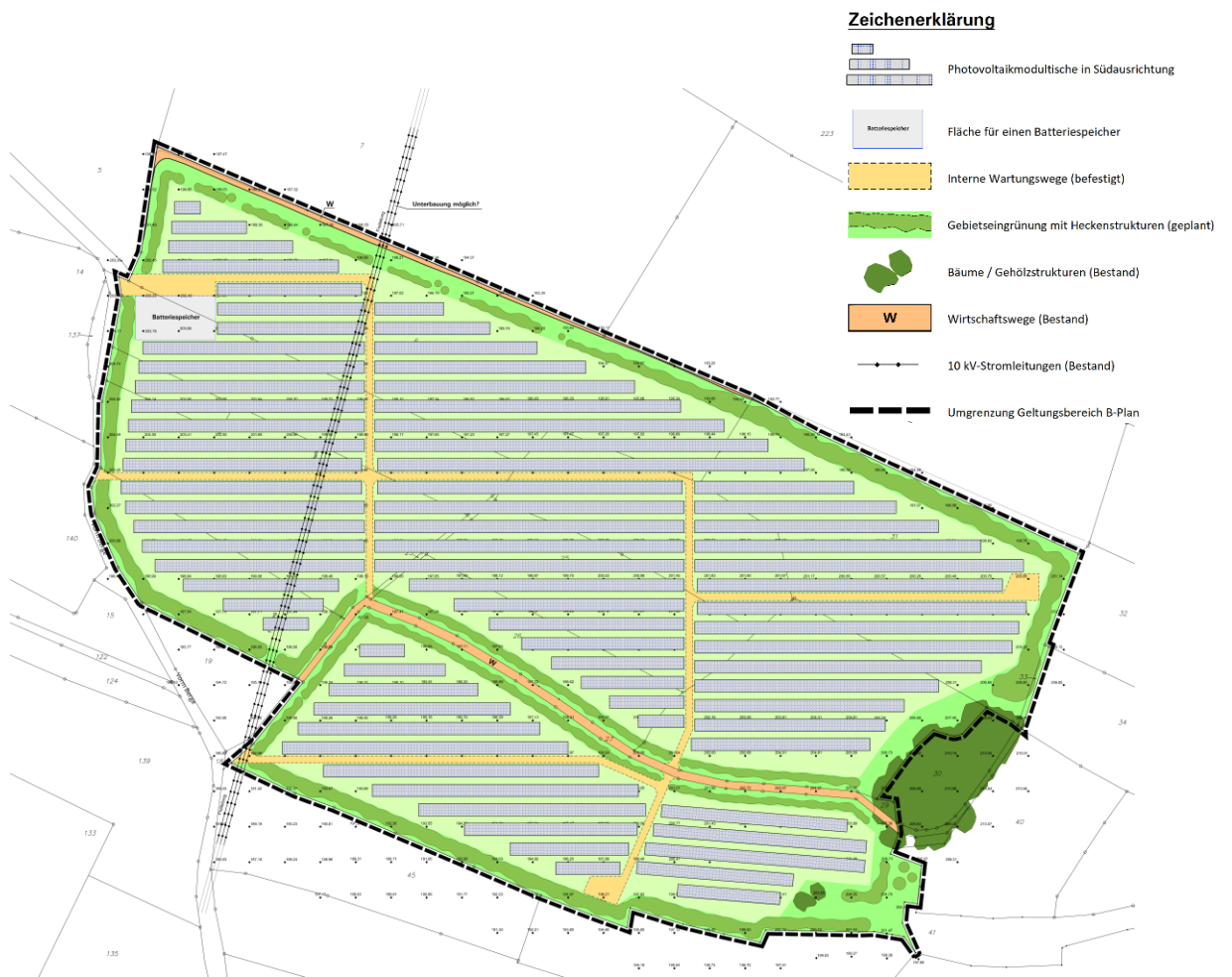
Abb. 1: Rahmenplan „Variante Südausrichtung“ (Tischmann Loh & Partner Stadtplaner PartGmbH, 02/2026)